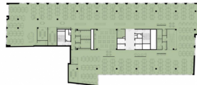
Przykładowy plan piętra: